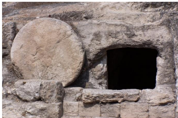
Tombe à meule, Israël, 1 er siècle ap. JC

L'apôtre Paul ne dit pas « vous ressusciterez », mais bien « vous êtes ressuscités, vous êtes une nouvelle créature » (Col 2:12). « Si le Christ n'est pas ressuscité, notre foi est vaine » (1Cor 15:14) : la foi c'est une relation avec une personne vivante, et non la croyance en un concept. La résurrection de Jésus n'est qu'un commencement, qui se terminera avec notre résurrection. La pierre a été roulée. Le tombeau est vide. Christ est vivant, il est à nos côtés, il nous inspire, il nous transforme, il nous ressuscite.